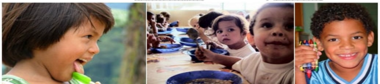
Justicia y solidaridad con los países empobrecidos

Por todo ello, uno de los acuerdos y compromisos que entendemos debe recoger esta Ley Foral de Justicia y Solidaridad Internacional, es la promoción de la economía solidaria como forma armónica de conjugar a los factores económicos como un medio al servicio de las personas, de la humanidad y del entorno, satisfaciendo de manera equilibrada los intereses respectivos de todos sus protagonistas, con el objetivo de crear empleos estables y favorecer el acceso a personas desfavorecidas, asegurando condiciones de trabajo y una remuneración digna, así como estimulando el desarrollo personal.