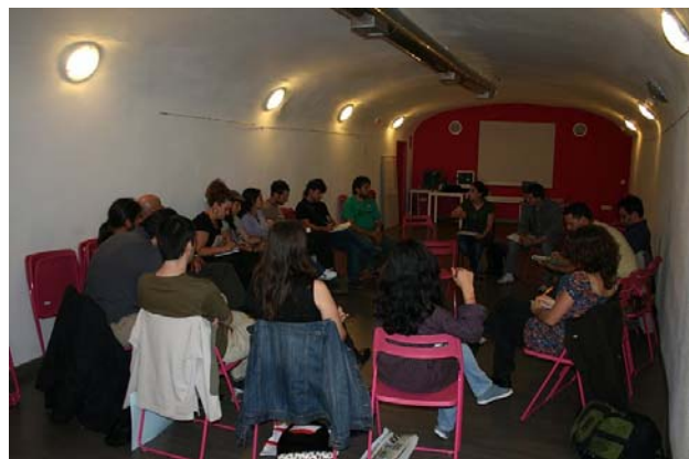
Taller sobre consumo responsable