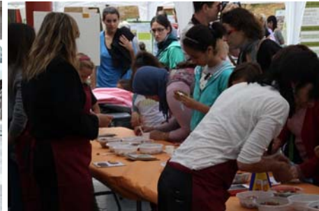
Taller de mosaicos