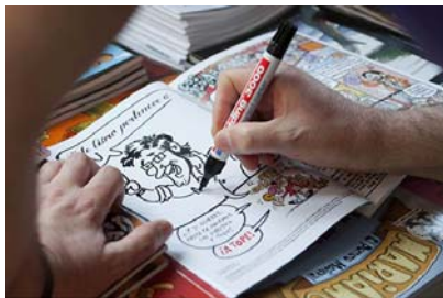
Caricaturas a cargo de Mala Vida