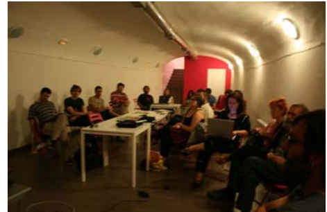
Taller sobre cultura libre