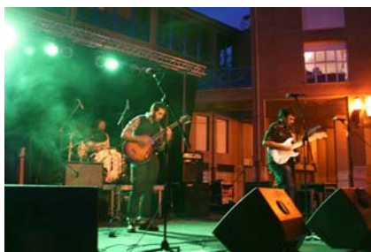
Royal Soul Spirografic Society