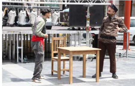
Compañía de teatro Romperlanzas